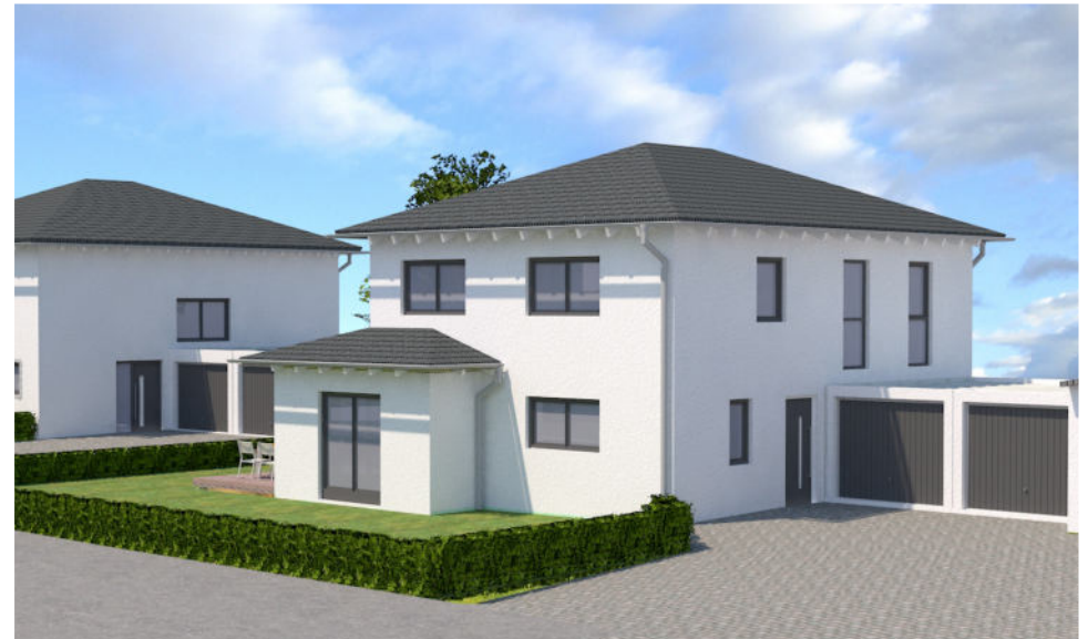
Ansicht von S Ü D - O S T E N