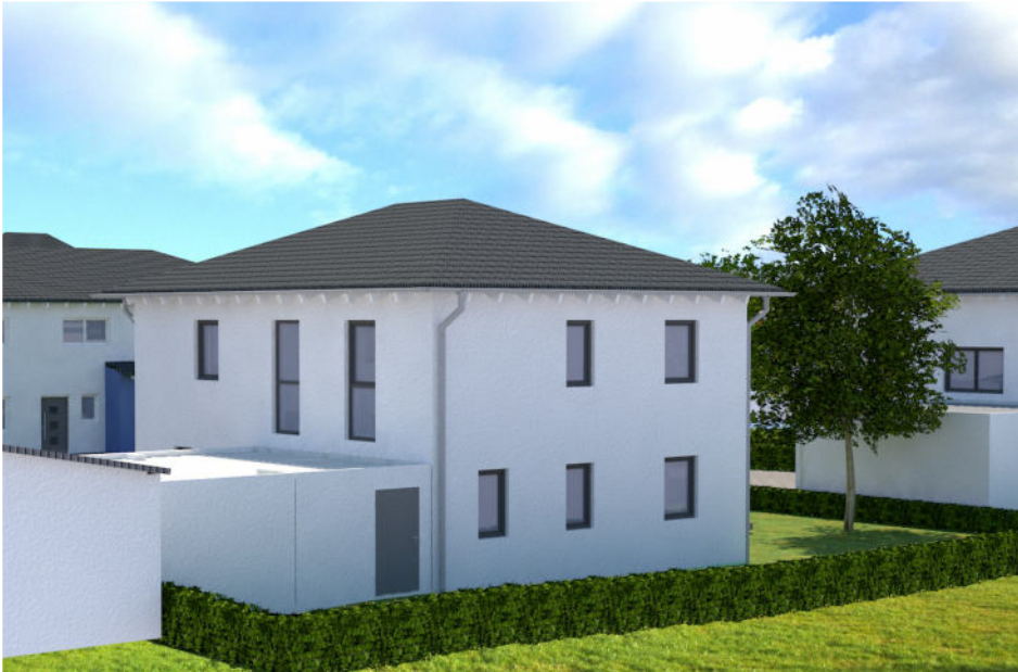
Ansicht von N O R D - O S T E N